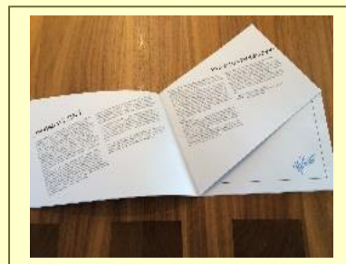
Een eerste preview van het boekje. Verrassende vorm, en dito columns.

Het boekje zal niet in de winkels te koop zijn en wordt in eigen beheer gerealiseerd. Uniek dus.