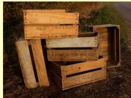
Uw product in de Zeeuwse kist? Neem contact op via info@iketgedogt.nl .

Bent u nog niet door ons benaderd, benader ons dan. Geen probleem.